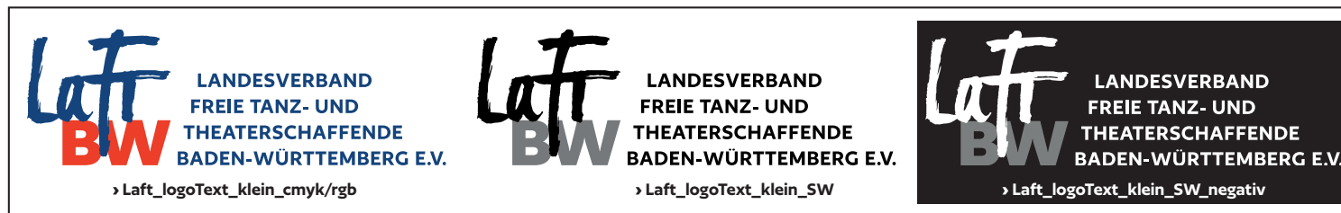
Logo in drei Varianten mit Text für Darstellung bis 2cm Höhe