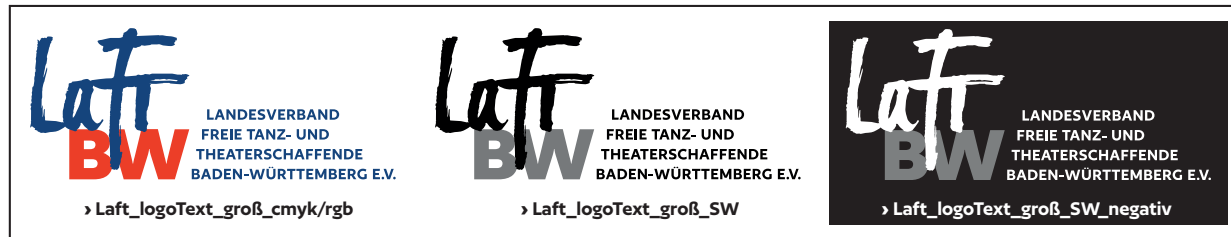
Logo in drei Varianten mit Text für Darstellung ab 2cm Höhe